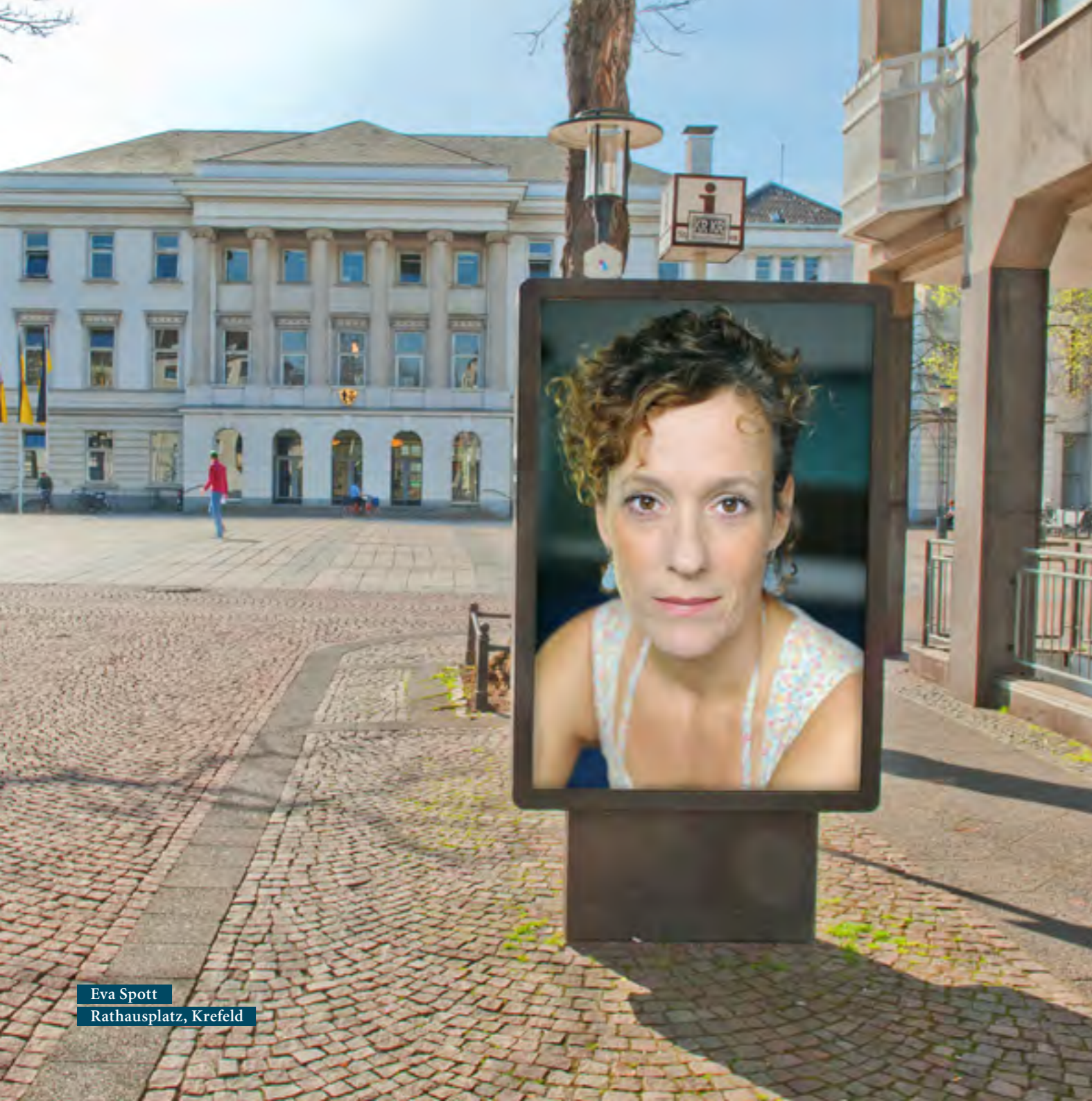
Eva Spott Rathausplatz, Krefeld

Inzenierung: Ali Samadi Ahadi Bühne und Kostüme: Dietrich von Grebmer