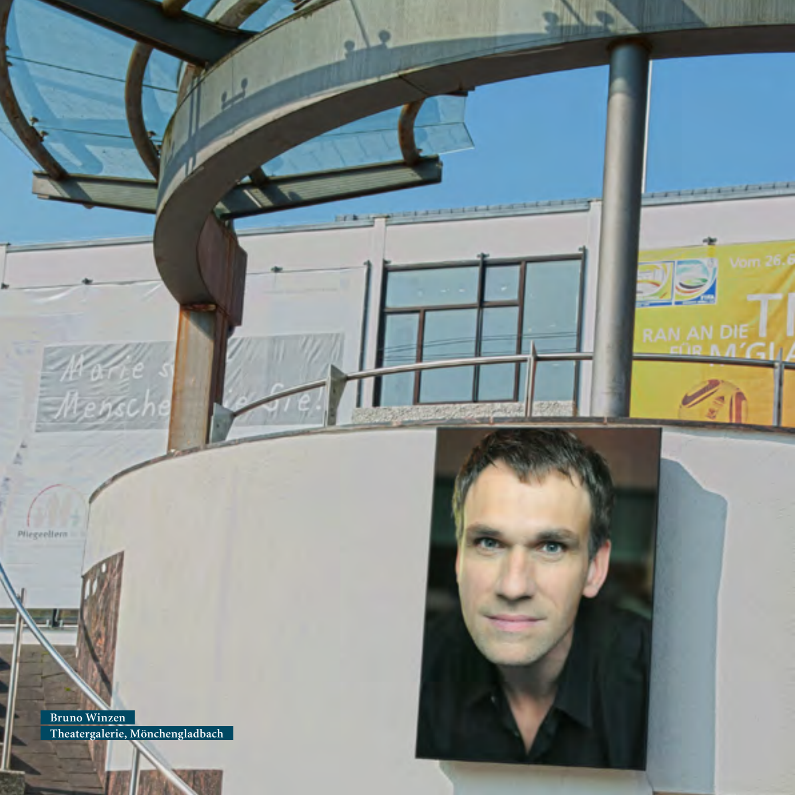
Bruno Winzen Theatergalerie, Mönchengladbach