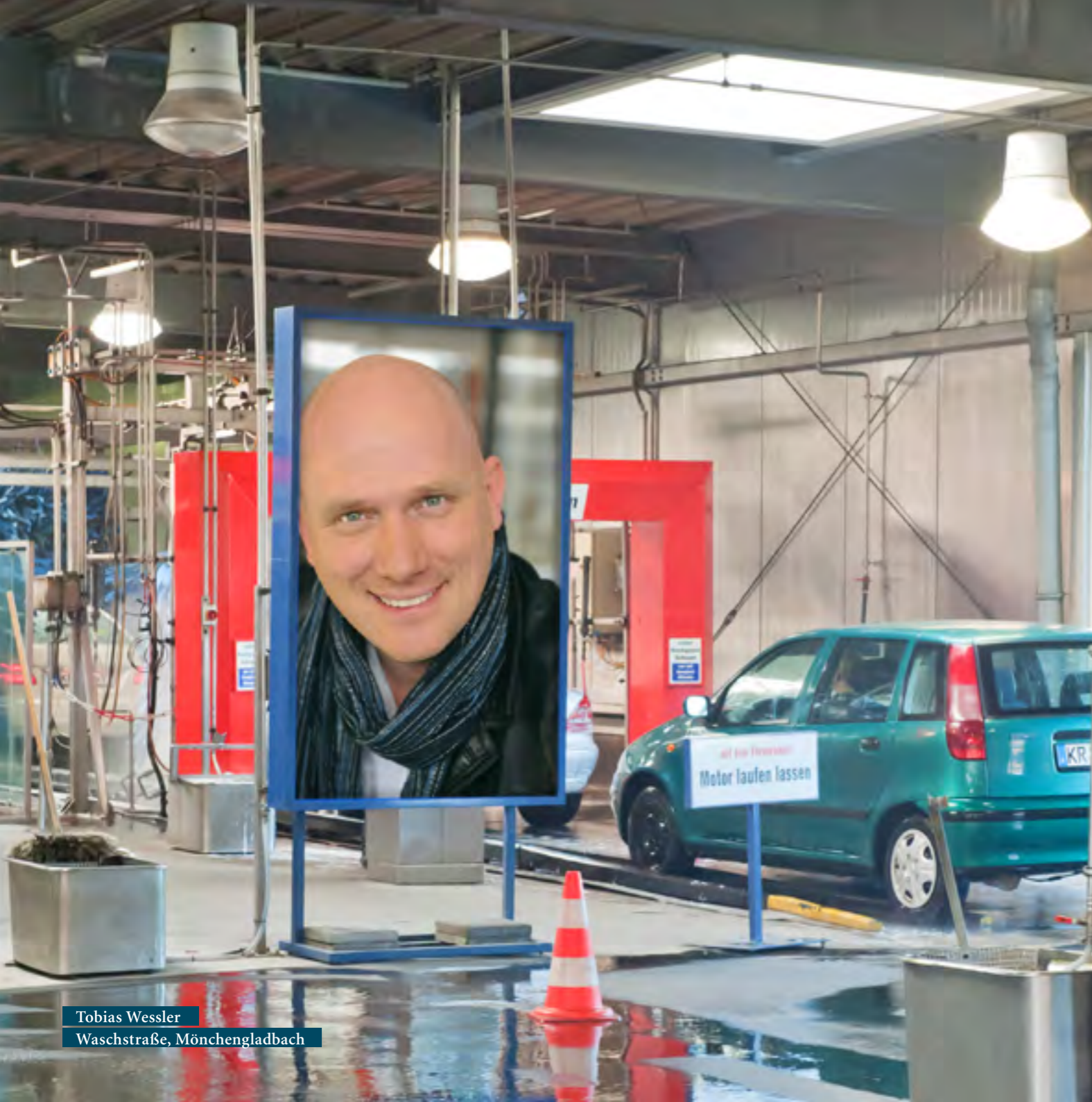
Tobias Wessler Waschstraße, Mönchengladbach

Inszenierung: Thirza Bruncken Bühne und Kostüme: Robert Ebeling